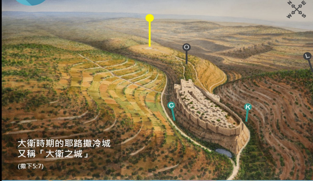
大衛時期的耶路撒冷城 又稱「大衛之城」 (撒下5:7)