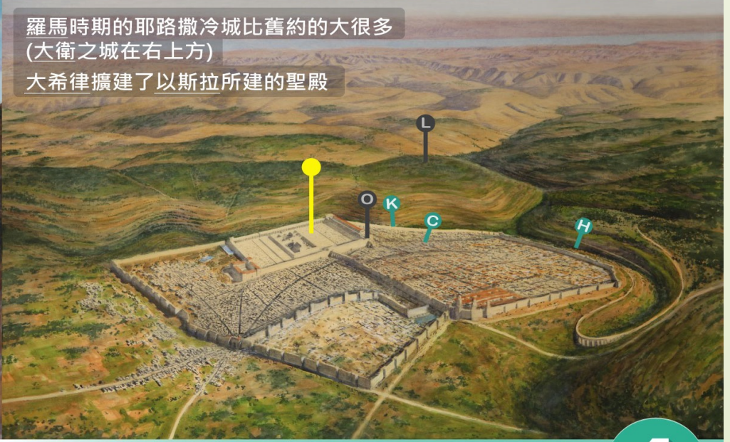
羅馬時期的耶路撒冷城比舊約的大很多 (大衛之城在右上方) 大希律擴建了以斯拉所建的聖殿