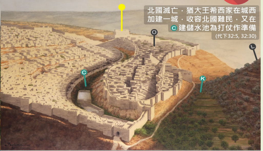
北國滅亡，猶大王希西家在城西 加建一城，收容北國難民，又在 C 建儲水池為打仗作準備 (代下32:5, 32:30)