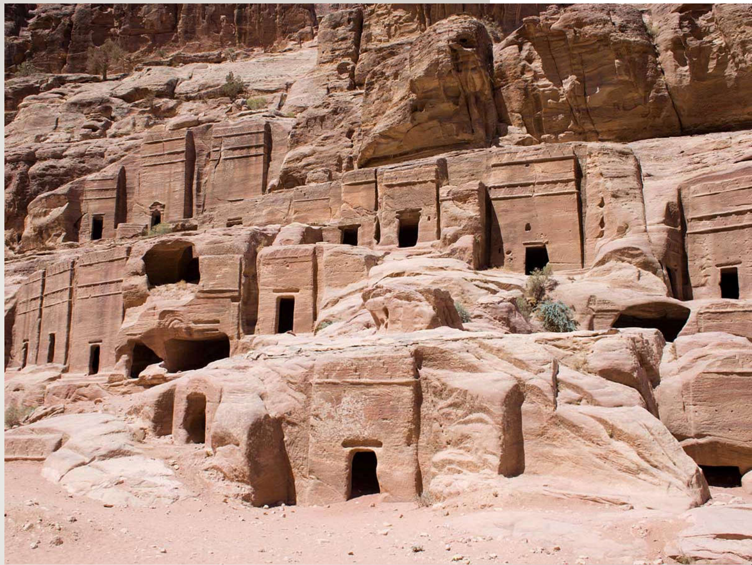
Petra 的石穴住地 (在提幔附近，納巴提王國時期遺跡) 以東亡國之後，該地區被阿拉伯人佔領，納巴提王國是其一。

➤ (箴11:2) 驕傲來，羞恥也來，謙遜人卻有智慧。(箴16:18) 驕傲在敗壞之先，狂心在跌倒之前。